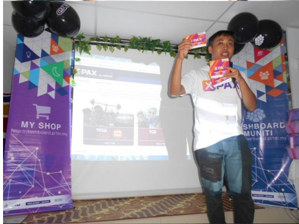
Taklimat dari pihak celcom