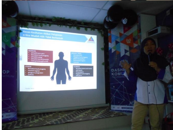
Taklimat klik dengan bijak